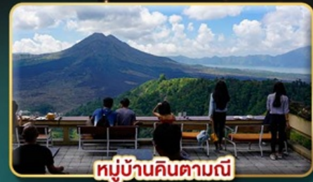
หมู่บ้านคินตามณี