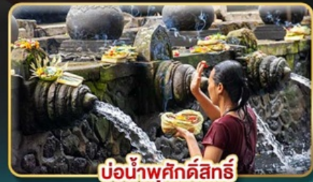
บ่อน้ำพุศักดิ์สิทธิ์