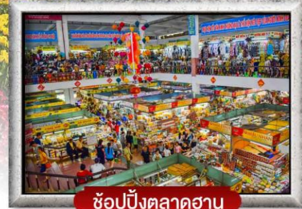
ซ้อปิ้งตลาดฮาน