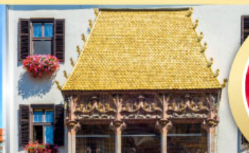
หลังคาทองคำอินน์สบวร์ค