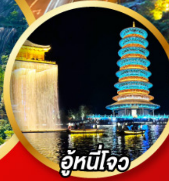
อู่หนี่โจว