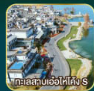
ทะเลสาบเอ๋อไห่โค้ง S