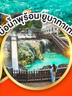
เขื่อนน้ำพุร้อนยูบาคาเกะ