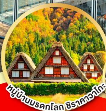
หมู่บ้านมรดกโลก ชิราคาวาโกะ