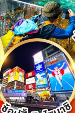
ช้อปปิ้งชินโจบาชิ