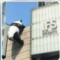
แพนด้ายักษ์ปิ่นตักIFS