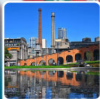
Eastern Suburb Memory Chengdu