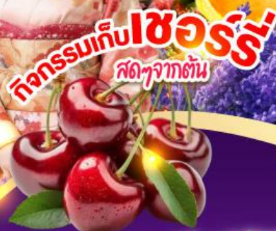
ทุ่งดอกลาเวนเดอร์ ไทมิตะฟาร์ม