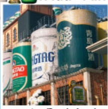
พาร์คที่โรงเบียร์ชิงเต่า