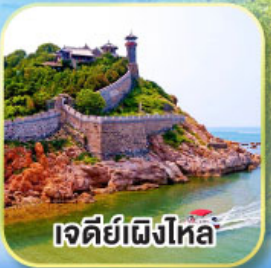
เจดีย์เฝิงโหล