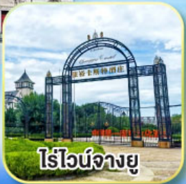
ไร์ไวน์จางยู