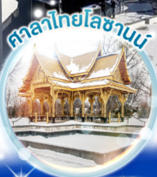
ศาลาไทยโลซานน์