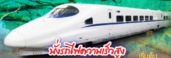
หนั่งรถไฟความเร็วสูง