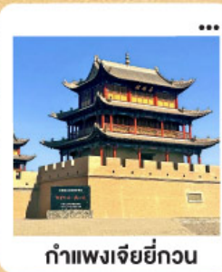
ถ้ำเพงเจียยี่กวน