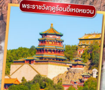
พระราชวังฤดูร้อนอู่เหอหยวน