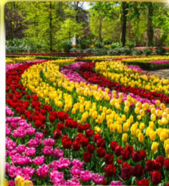
เทศกาลดอกไม้เคเคนฮอฟ