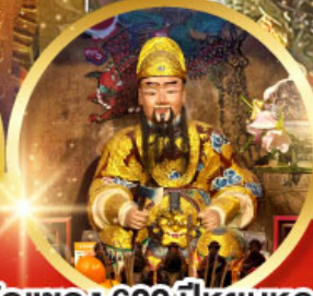
วัดแซกง 600 ปี หุ่นทอง