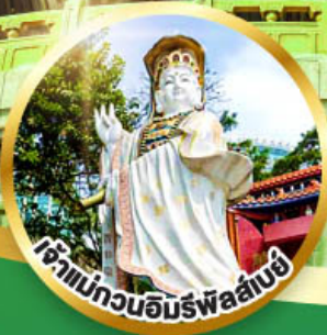
เจ้าแม่กวนอิมพรหลั่งน้ำทิพย์