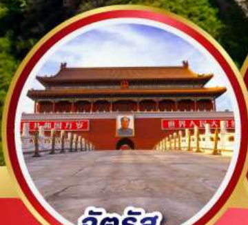
จัตุรัส เทียนอันเหมิน