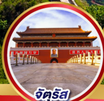
จัตุรัส เทียนอันเหมิน