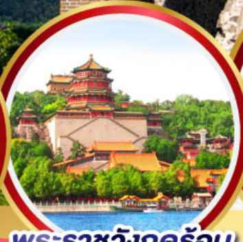
พระราชวังฤดูร้อน อิ๋ห่อยวน