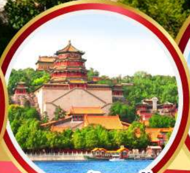
พระราชวังฤดูร้อน อ้อหอยวน