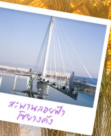
สะพานลอยฟ้า โซฮางดง