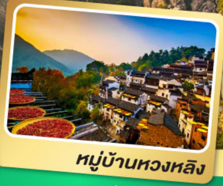
หมู่บ้านหวงหลิง