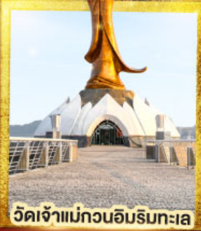
วัดเจ้าแม่กวนอิมริมทะเล