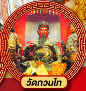
วัดกวนไท