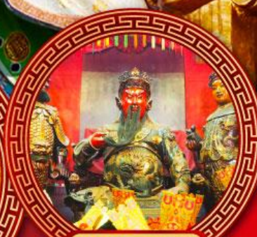
วัดกวนไท