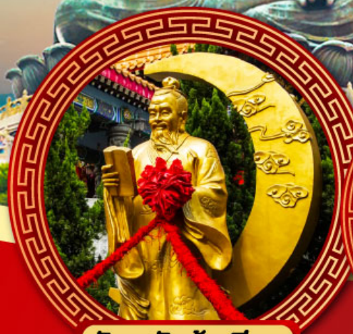
วัดหวังต้าเซียน