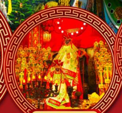
วัดเจ้าแม่กวนอิม ฮ่องกง