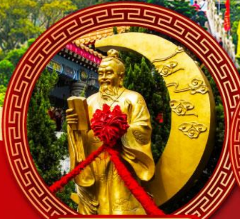
วัดหวังต้าเซียน