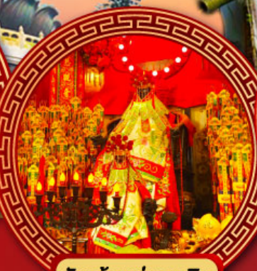
วัดเจ้าแม่กวนอิม ฮ่องกง