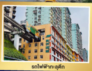
รถไฟฟ้า-ลู่ตัก