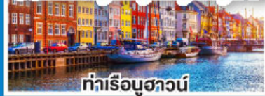
ท่าเรือฮาวน์

ล่องเรือสำราญสุดหรู DFDS พร้อมห้องพักแบบ Sea View