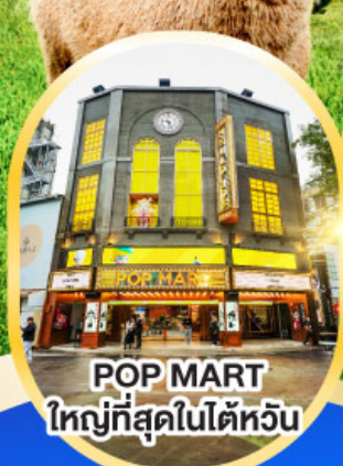
POP MART ใหญ่ที่สุดในไต้หวัน