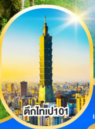
ตึกไท่เปี101