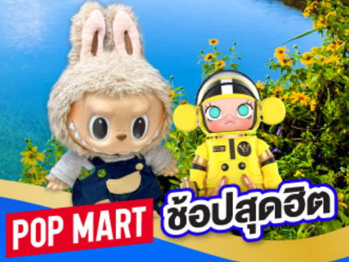
POP MART ซ้อปสุดฮิต