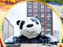
หมีแพนด้าปิ่นตึก