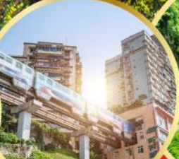
รถไฟฟ้าทะเลตึก