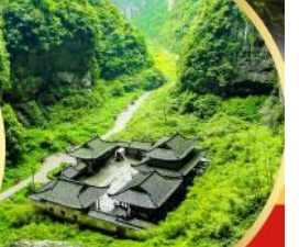
หลุมฟ้าสะพานสวรรค์