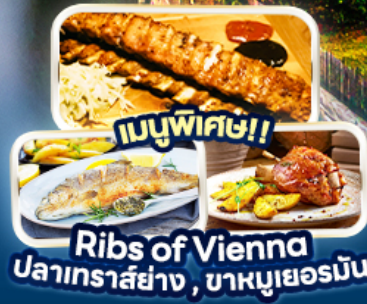
เมนูพิเศษ! Ribs of Vienna ปลาเทราสย่าง, บาหมูเยอรมัน