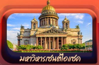
มหาวิหารเซ็นต์ไอแซค