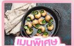
เมนูพิเศษ หอยออสตาโก้