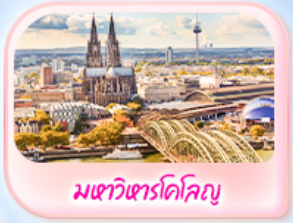
มทาวีซาร์โคโลญ