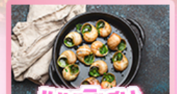
เมนูพิเศษ หอยเอสคาโท