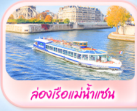
คลองเรือแม่น้ำแซน