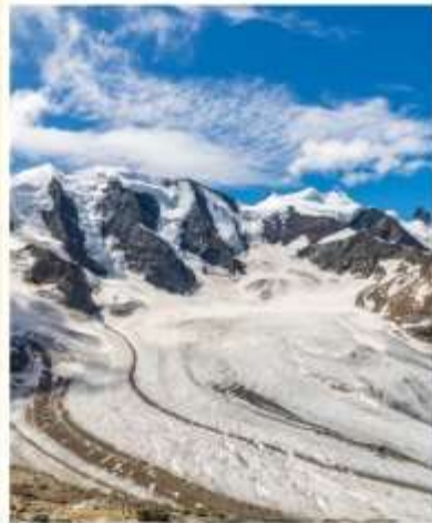
DIAVOLEZZA Piz Bernina Peak