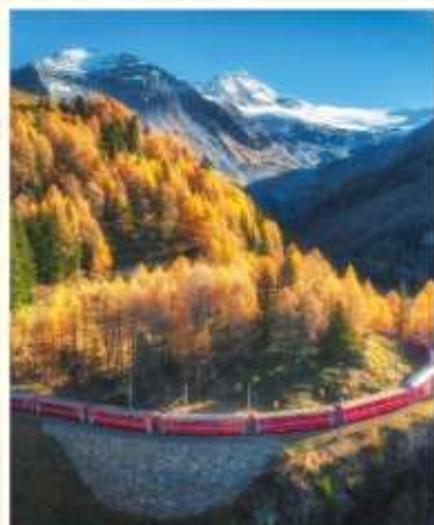
BERNINA EXPRESS GoldenPass Express