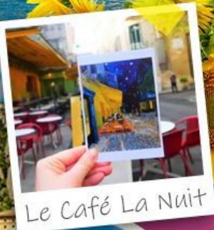
Le Café La Nuit