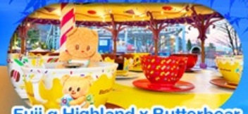
Fuji q Highland x Butterbear เดินทาง พ.ค. 69 เป็นต้นไป