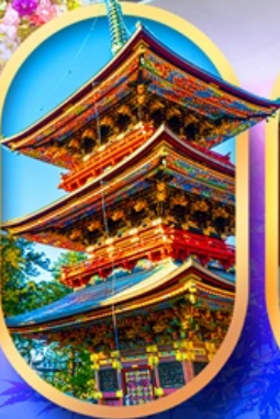
วัดนาริตะชิน