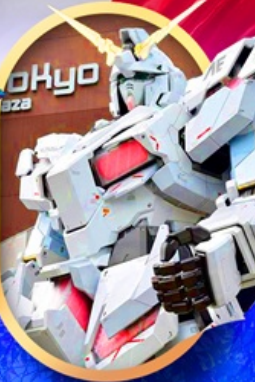
ห้างไอโดะบะกันดัม