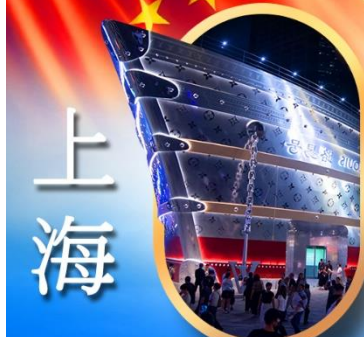
เรือคอะหลุยส์