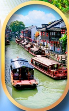
ถนนชานงังเจีย