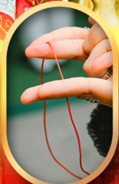
เสริมดวงความรัก