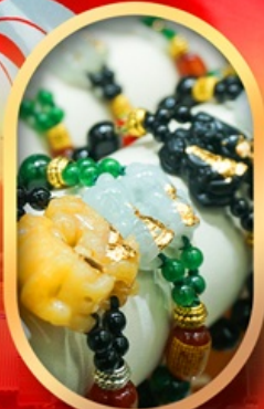
ร้านหยกอัญมณี