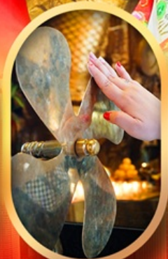
หมอนกั้งหันแซง