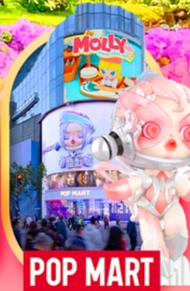
ช้อปปิ้งถนนหนางจิง