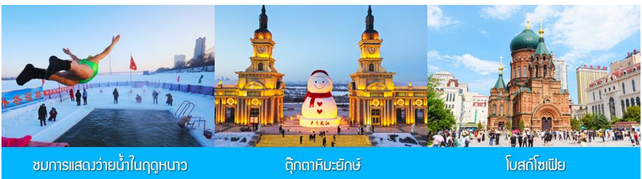
ชมการแสดงว้ยน้ำในฤดูหนาว

พักที่ HARBIN SHUIMU CITY SPRING HOTEL 4* หรือโรงแรมในระดับเดียวกันย่านชานเมืองฮาร์บิน