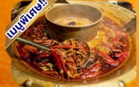
หม้อไฟเสฉวน