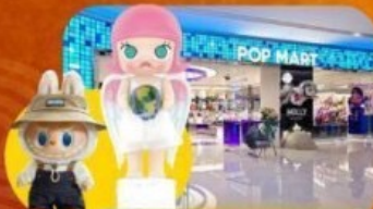
ข้อปึงจุ่ม POP MART