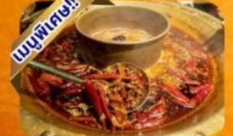
หม้อไฟเสฉวน