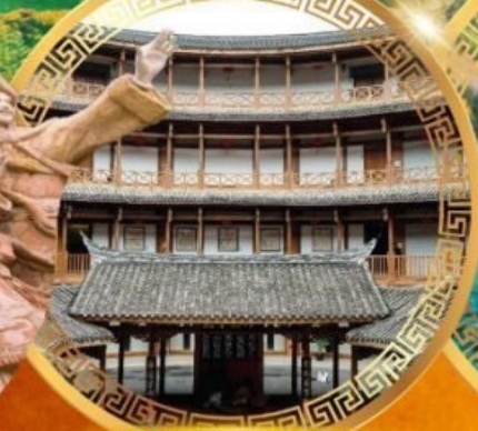
เมืองโบราณลั่วใต้