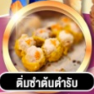
ต้มซ่าต้นตำรับ