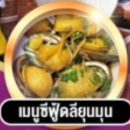
เมนูซีฟู้ดสัญมณฑุ