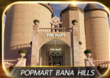
POP MART BANA HILLS

สัมผัสความงามหมู่บ้านฝรั่งเศสที่บานาฮิลล์ ช้อปปิ้ง POPMART