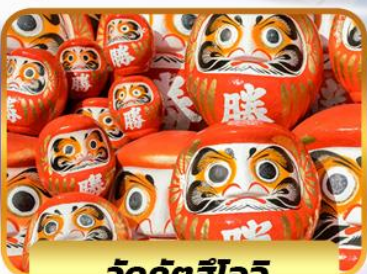
วัดคัตสึโอจิ