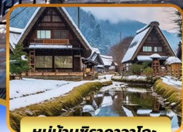
หมู่บ้านชิราคาวาโกะ

ไอซาก้า คุสัทซึ คาวาโกเอะ ทากายามา โตเกียว