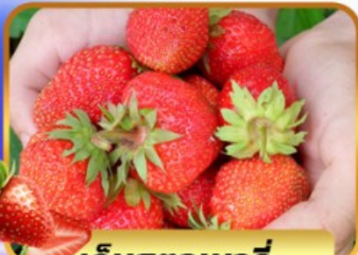
เก็บสตอเบอร์รี่