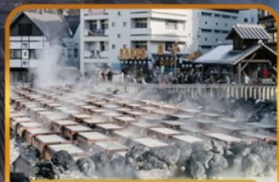
ชมยูบาทาเกะ