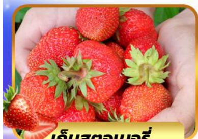
เก็บสตอเบอร์รี่