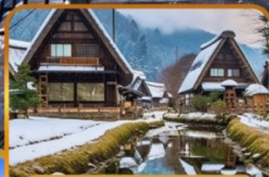
หมู่บ้านชิราคาวาโกะ

ไอซาก้า คุสัทซึ คาวาโกเอะ ทากายามา โตเกียว