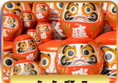
วัดคัตสึโงจิ