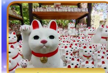
วัดโทโทคุจิ