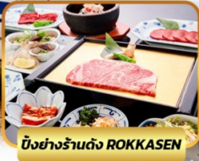
บึงย่างร้านดัง ROKKASEN