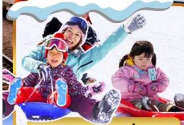
กิจกรรมภาคเลื่อนหิมะ