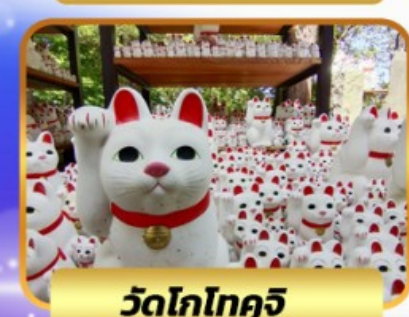
วัดโทโทจิว