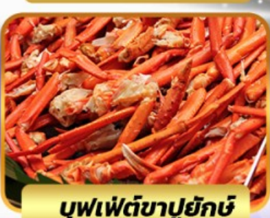
บุฟเฟ่ต์ขาปูยักษ์

ฟรีเดย์โตเกียว 1 วัน อิสระ ช้อปปิ้งหรือช้อปปิ้งที่เซริมิตสึนีย์แลนด์ 27 ธ.ค. - 01 ม.ค. 2568