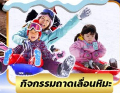
กิจกรรมภาคเลื่อนหิมะ