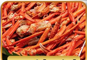
บุฟเฟ่ต์ขาปูยักษ์

ฟรีเดย์โตเกียว 1 วัน อิสระช้อปปิ้งหรือช้อปปิ้งทัวร์เสริมดั่งสนีย์แลนด์ 27 ธ.ค. - 01 ม.ค. 2568