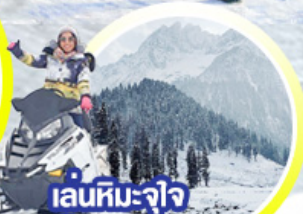
เล่นหิมะ-จาว ให้หายคิดถึง