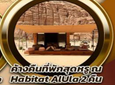
ค้ำคืนที่พักสุดหรู ณ Habitat AlUla 2 คืน