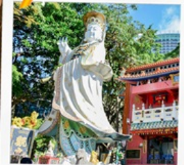
เจ้าแม่กวนอิมรพัสลเบย์