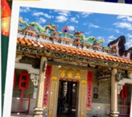
วัดปักไต่