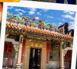
วัดปักไต้