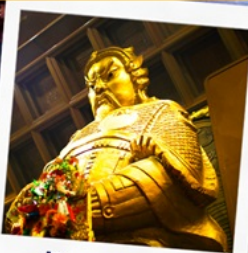
วัดเชกงหวี