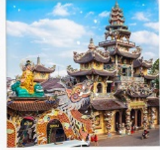
วัดมังกร