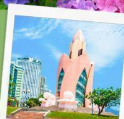
อาคารตอกบัว