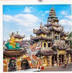
วัดมังกร