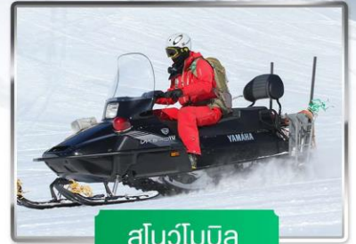
สโนว์โมบิล