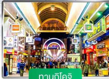
ทานุกิโคจิ