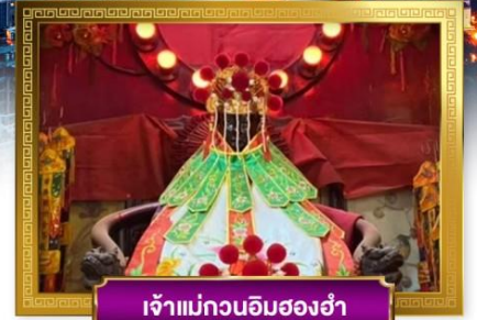
เจ้าแม่กวนอิมสองฮ่า