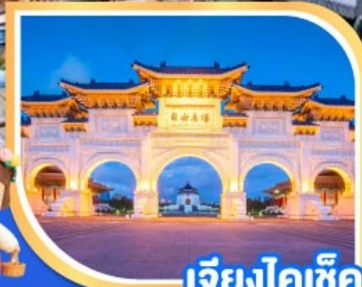
เจียงไคเช็ค